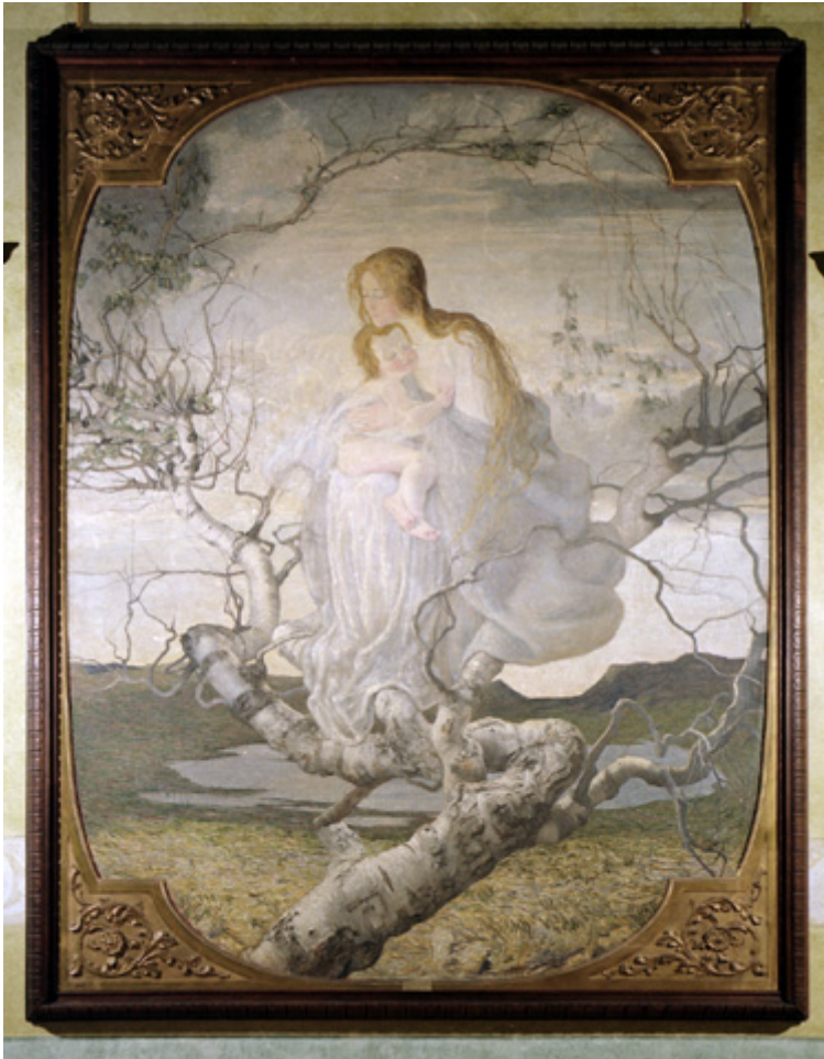
Giovanni Segantini : Dea dell'amore