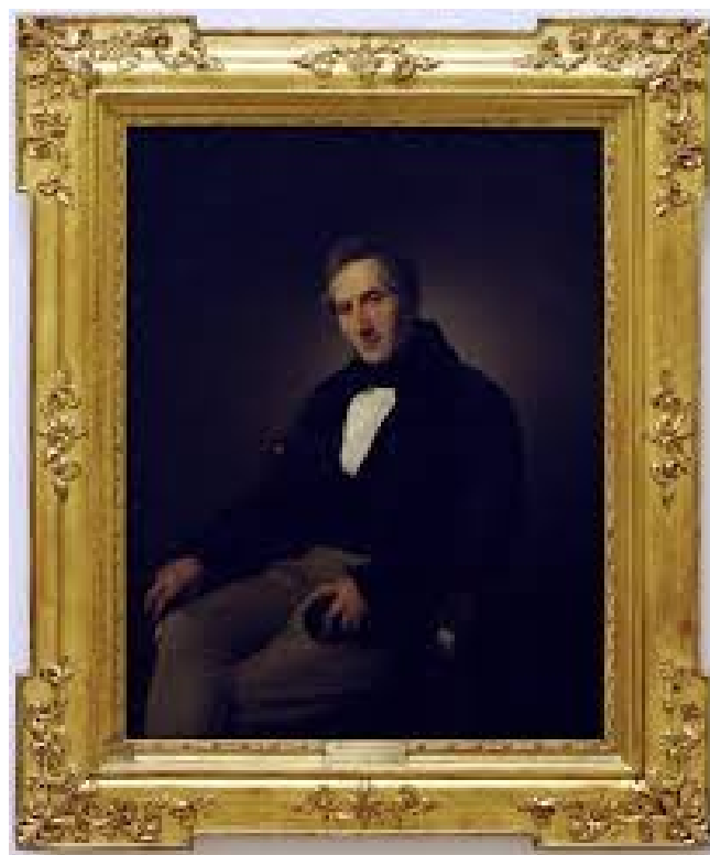
Francesco Hayez :ritratto di Alessandro Manzoni