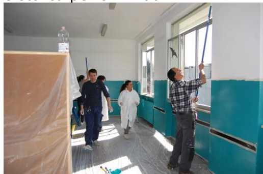
l'aula di scienze

Il 19 febbraio è stata la giornata di "M'illumino di meno" proposta da Rai Radio2 dodici anni fa. Alle ore 12.00 di questa giornata bisognava spegnere la corrente elettrica per 5 minuti.