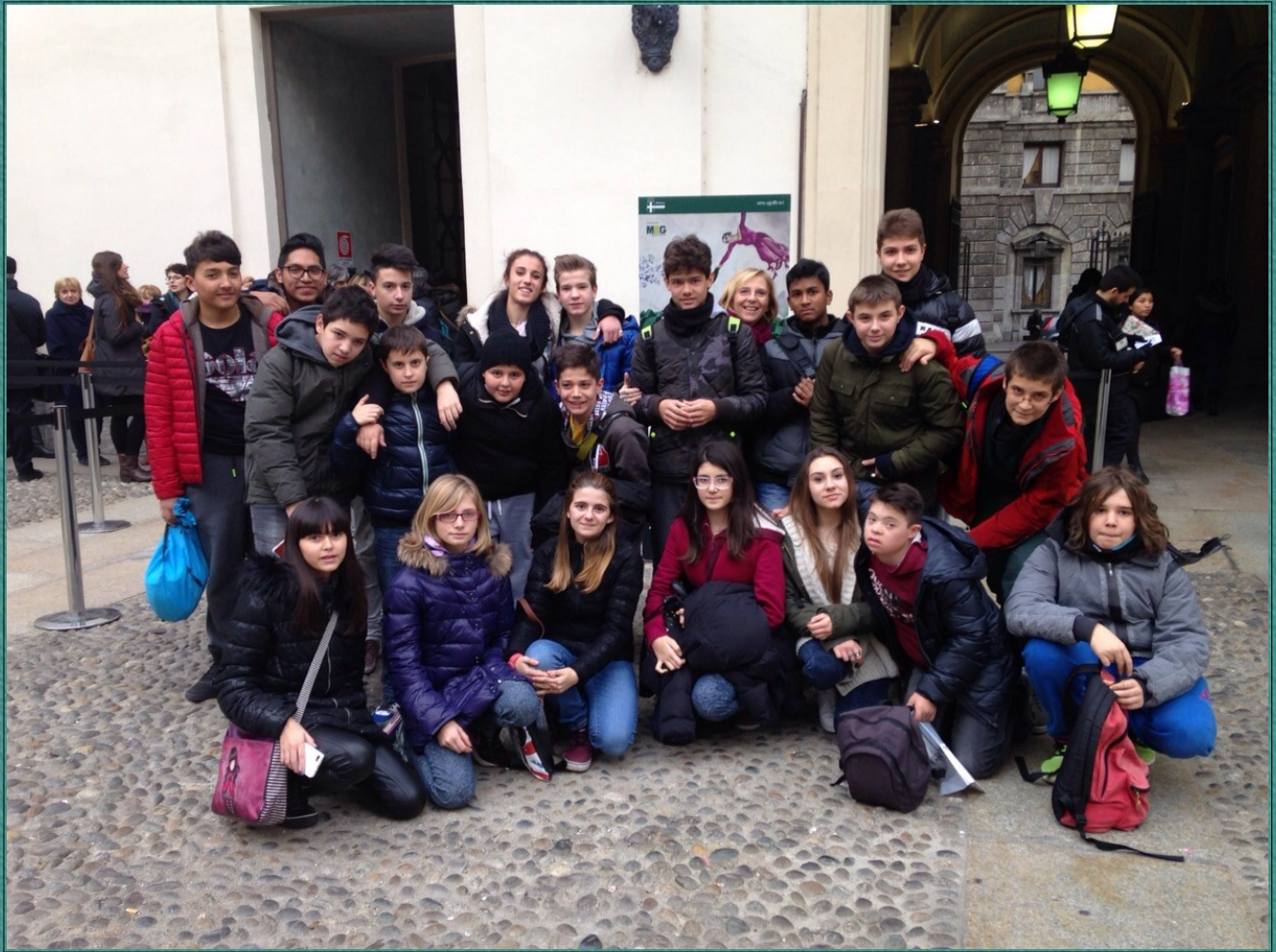
Classe III F